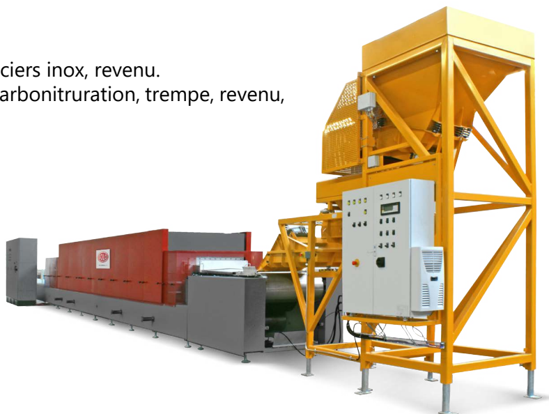
Fours continus SOLO® 322, 1150°C