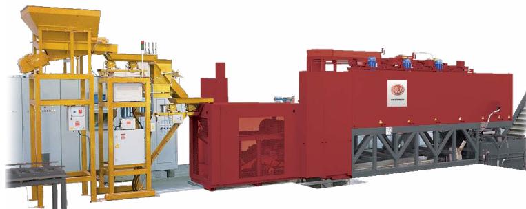
Fours continus SOLO® 302, 1050°C avec bac de trempe