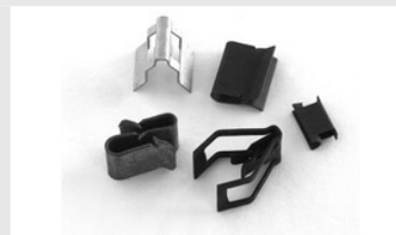
Éléments de fixation