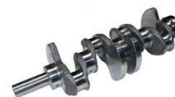
Vilebrequins et engrenages