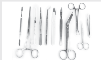
Médical et dentaire