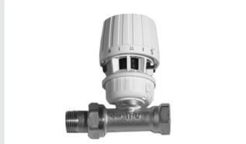
Vannes et raccords