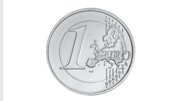
Monnaies et médailles