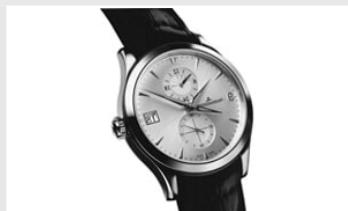
Horlogerie et bijouterie